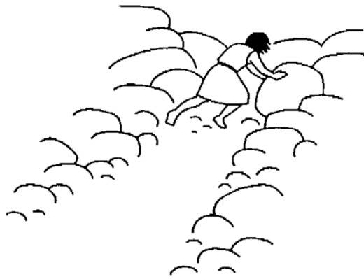
Dessin de Kieffer

Ce calendrier a été réalisé en partenariat avec les diocèses de Paris et de Meaux.