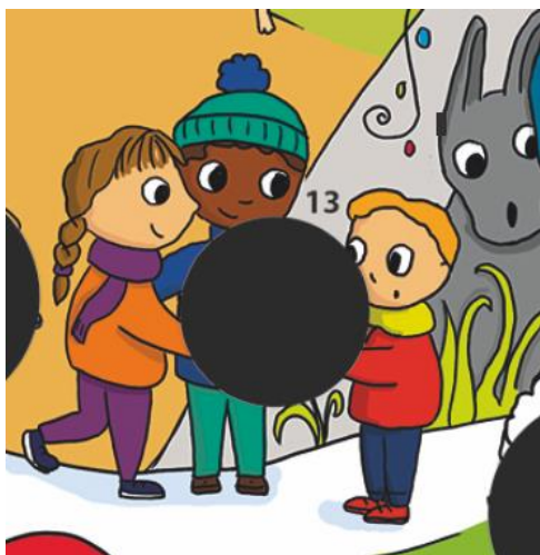
3 e dimanche de l'Avent de ton calendrier

https://diocese92.fr/Les-calendriers-de-l-Avent-sont-disponibles-dans-vos-eglises