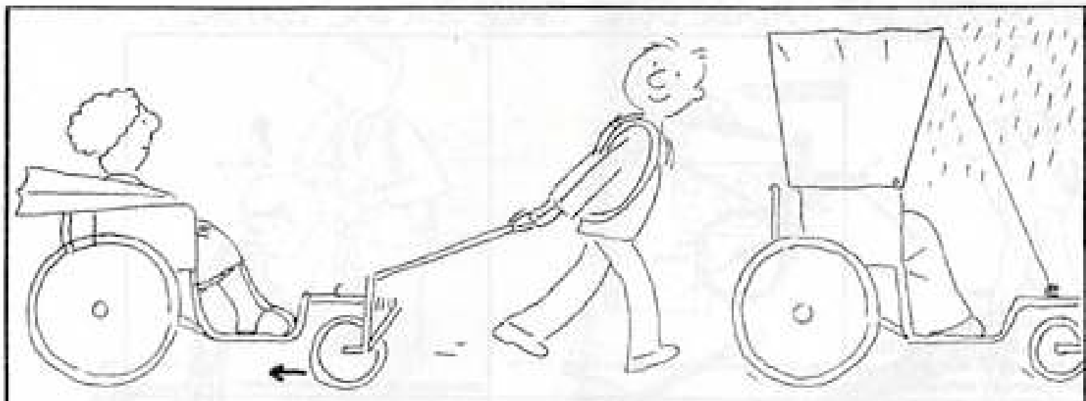
roue avant dirigée vers la voiture (ressort dans le sens de la marche)