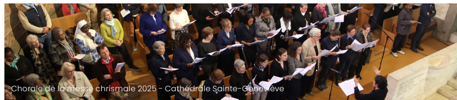
Chorale de la messe chrismale 2025 - Cathédrale Sainte-Généviève

Contact : musiqueliturgique@diocese92.fr