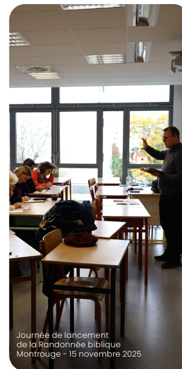
Journée de lancement de la Randonnée biblique Montrouge - 15 novembre 2025