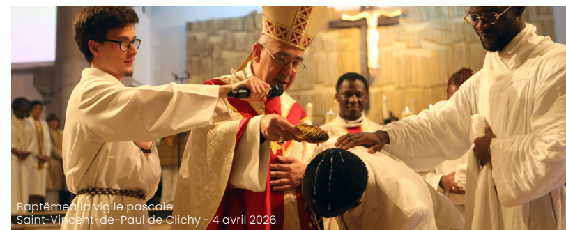
Baptême à la vigile pascale Saint-Vincent-de-Paul de Clichy - 4 avril 2026