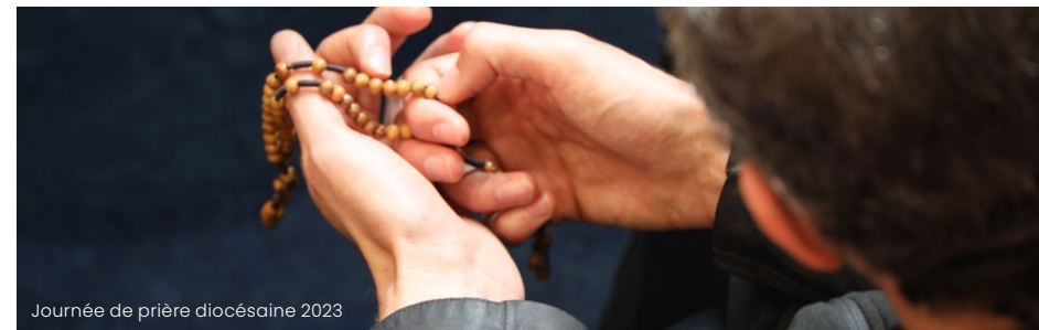
Journée de prière diocésaine 2023

Jeudi 18 mars > Maison de la Parole Contact : formation@diocese92.fr