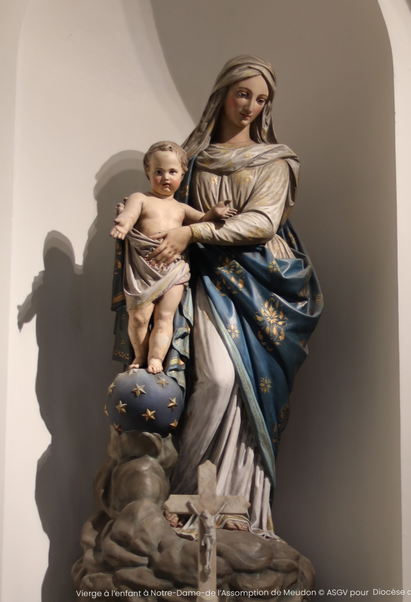
Vierge à l'enfant à Notre-Dame-de l'Assomption de Meudon