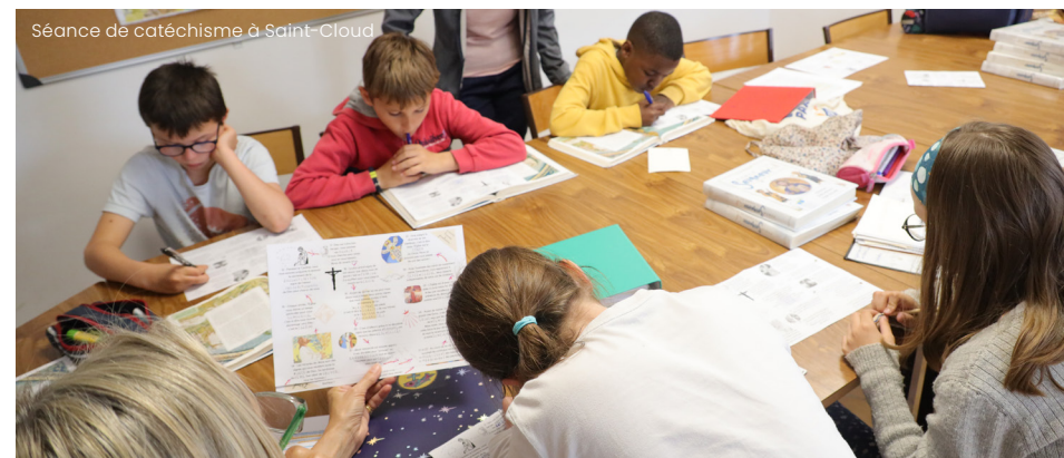
Séance de catéchisme à Saint-Cloud