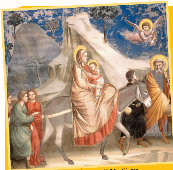
La fuite en Égypte, 1305, Giotto, Chapelle des Scrovegni, Padoue (Italie)

Pour fuir en Égypte, il est possible que Joseph ait trouvé un âne pour transporter Marie et Jésus.