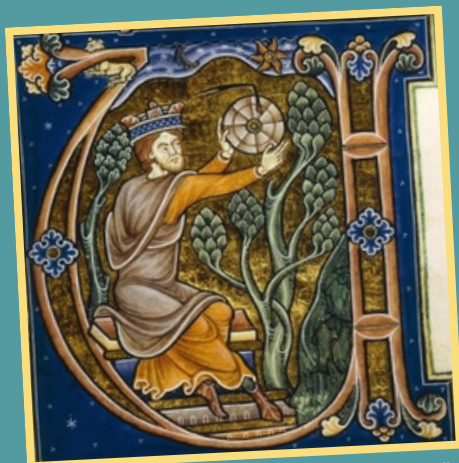
Anonyme, "Salomon observant les astres", initiale de l'Ecclésiaste, Bible des capucins, vers 1170-1180, BNF

★ Le roi Salomon était très sage : est-ce que ça veut dire qu'il obéissait bien à ses parents ?